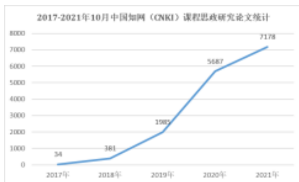
图1 2017年至今中国知网（CNKI）收录关键词为“课程思政”的论文统计